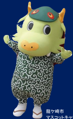
龍ヶ崎市 マスコットキャラクター 『まいりゅう』