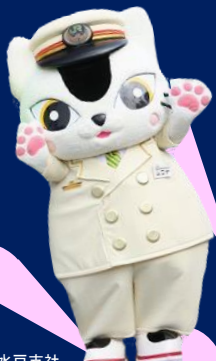
JR 東日本水戸支社 E657系イメージキャラクター 『ムコナくん』